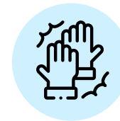
EVITAR SALUDO DE MANO Y/O BESO