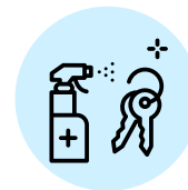
ENTREGAR LLAVES EN DISPENSADOR PARA DESINFECCIÓN CADA VEZ QUE SALGA