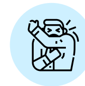
CUBRIR BOCA Y NARIZ CON EL CODO DOBLADO ALTOSER O ESTORNUDAR.