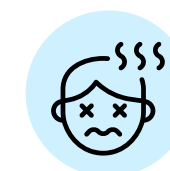
ALERTA A LOS SINTOMAS FIEBRE 37,8, TOS DIFICULTAD RESPIRATORIA, DOLOR DE CABEZA O MUSCULAR