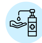
DESINFECTAR LAS MANOS CON ALCOHOL GEL