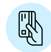
PAGO PREFERENTE CON TARJETA O TRANSFERENCIA