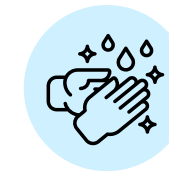
LAVAR LAS MANOS CON AGUA Y JABÓN