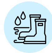
LIMPIEZA DE CALZADO EN PEDILUVIO