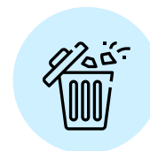
DESECHAR MASCARILLA, EN BOLSA CERRADA