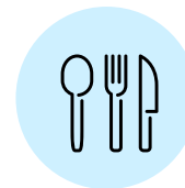
NO COMPARTIR TUS CUBIERTOS