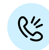
ANTE LOS SÍNTOMAS, LLAMAR A SALUD RESPONDE 800 472 300