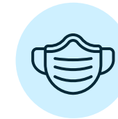
USO OBLIGATORIO DE MASCARILLA